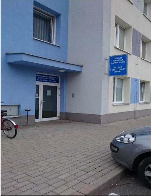
vedlejší vstup do budovy polikliniky