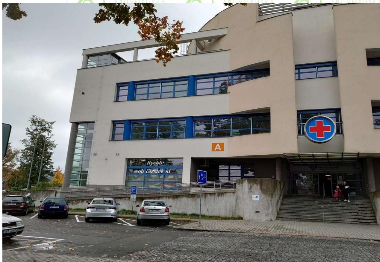
vstup A1 - hlavní vstup zepředu budovy