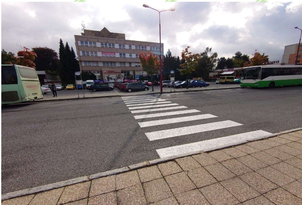
snížený obrubník na jedné straně