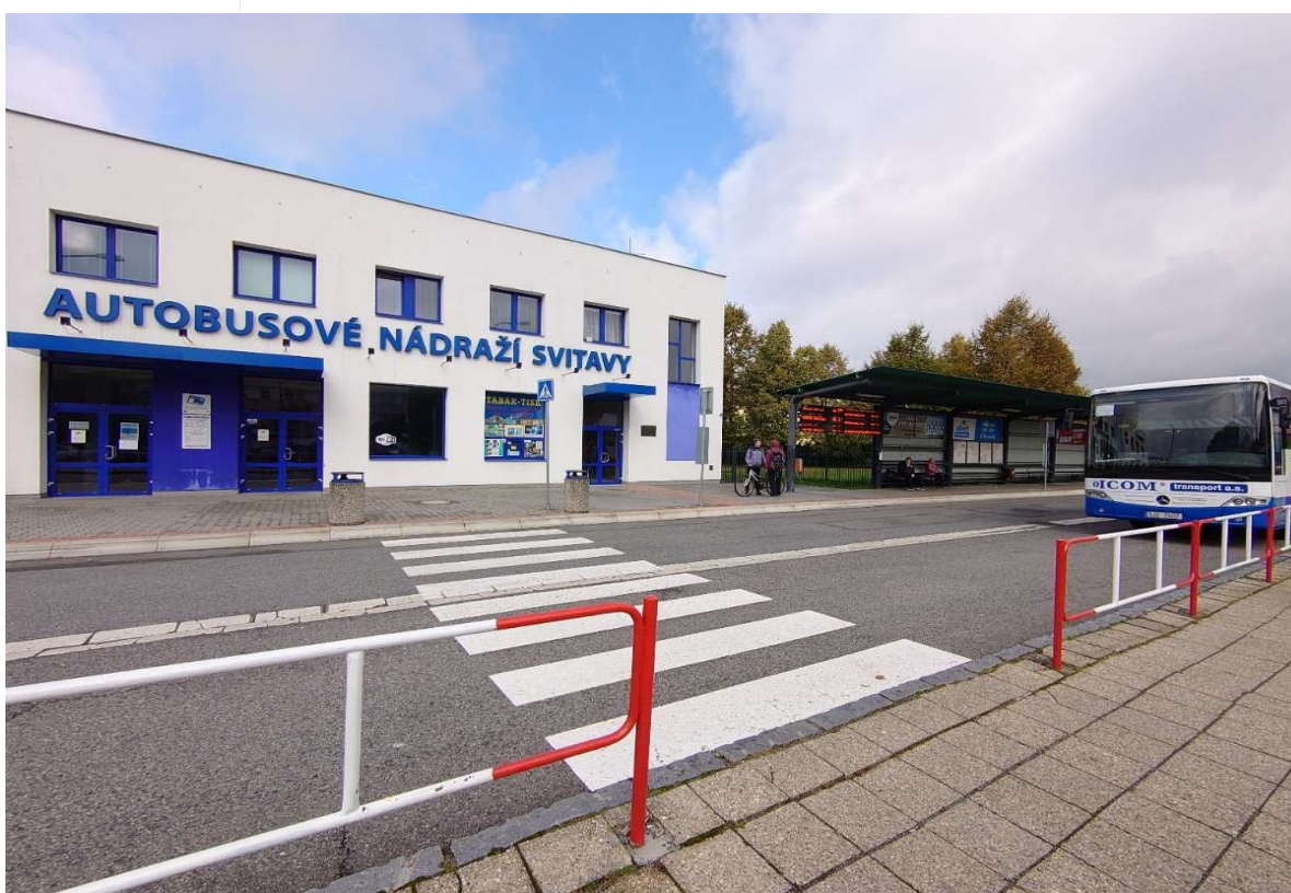
nesnížené obrubníky mezi nástupišti