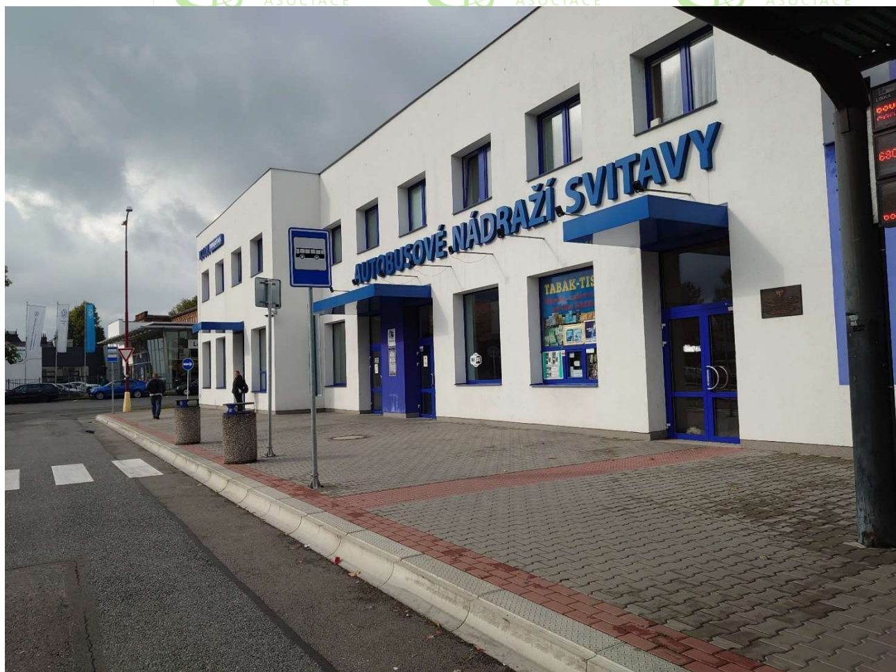
budova autobusového nádraží

Nástupiště u nádražní budovy přístupné , výška nástupní hrany 180mm. Opatřeno vizuální úpravou, signálními pásy a vodící linií pro nevidomé a slabozraké.