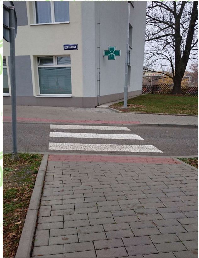
Přístup od Nemocnice k Poliklinice po chodníku - přechod pro chodce (2x) se sníženými obrubníky na obou stranách.