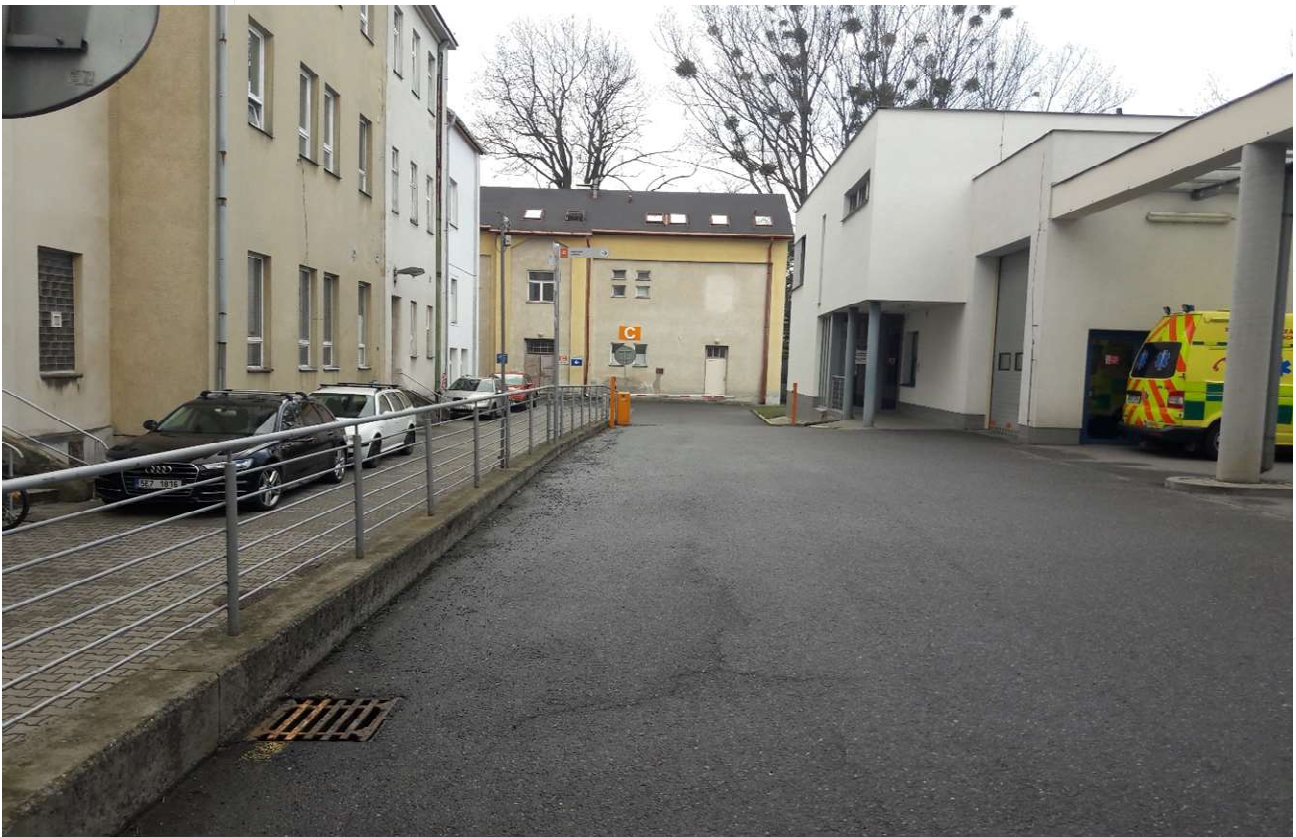
Komunikace od vstupu A3 k budově C a D.