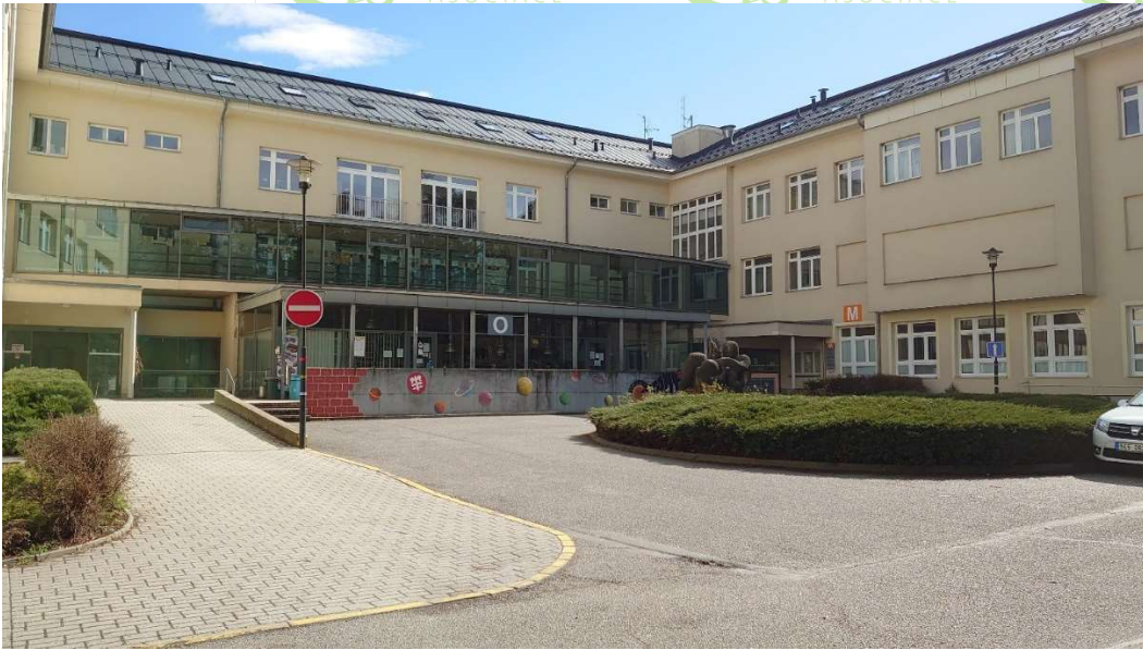
Anesteziologická ambulance v prostorách Gynekologické ambulance - 1.NP (vlevo)