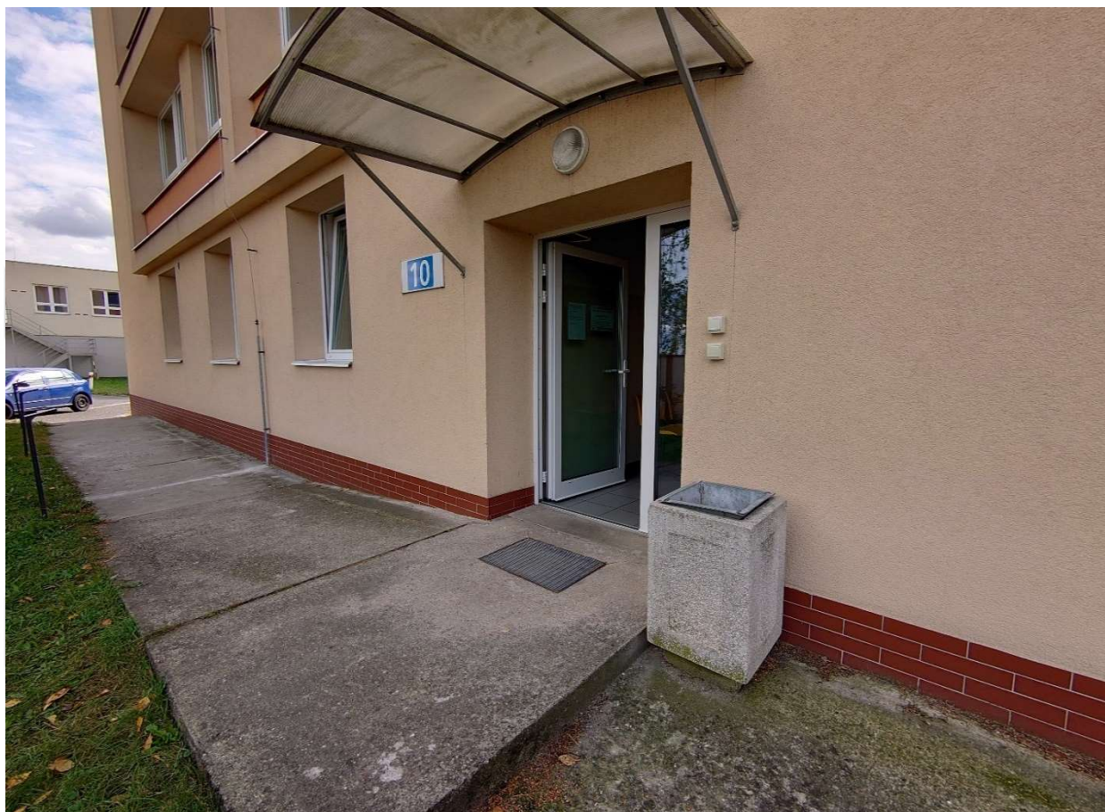
Budova č.10 - Vstup do ambulance praktického lékaře pro dospělé