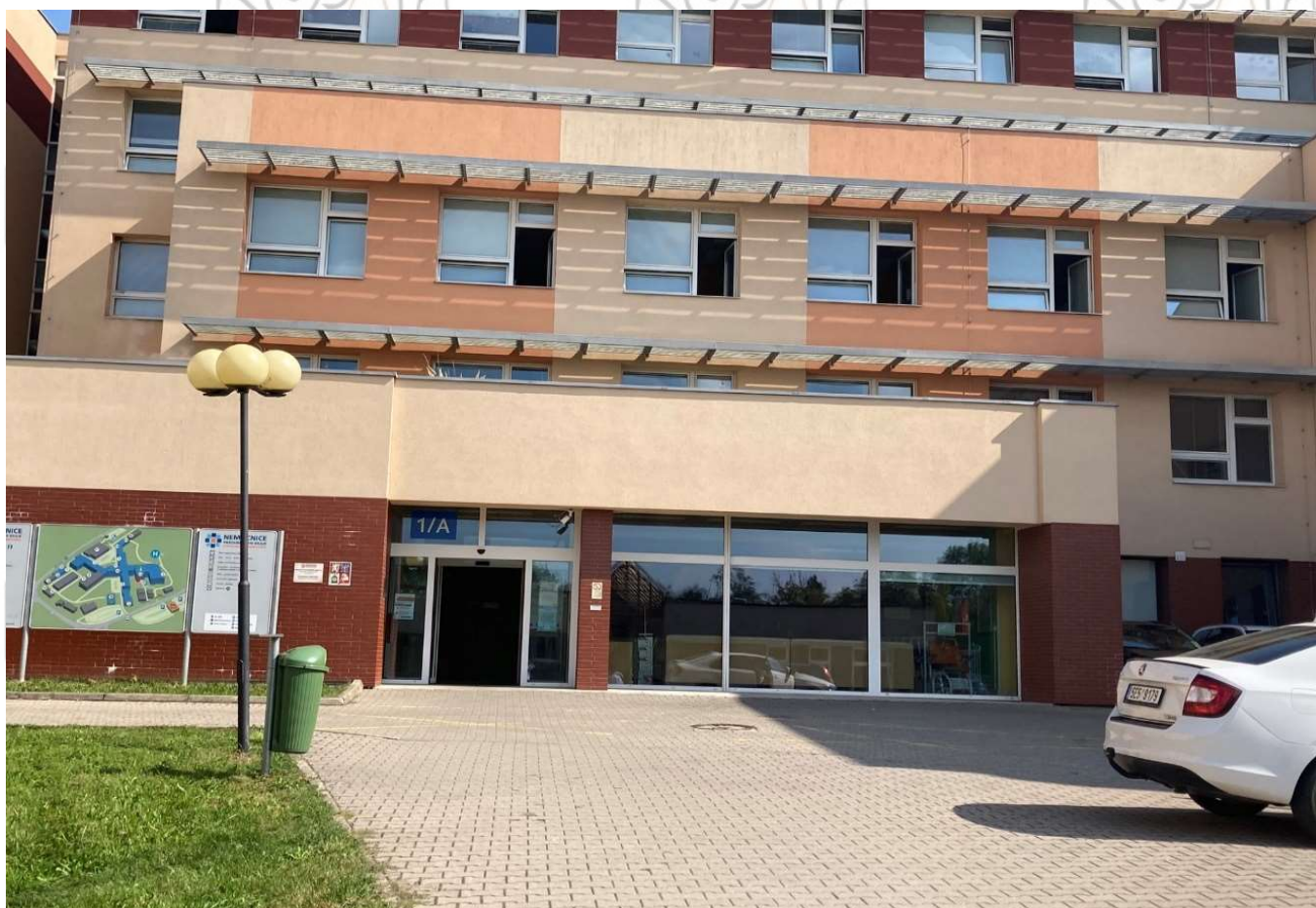
Hlavní vstup 1/A (od hlavního vjezdu do areálu nemocnice)