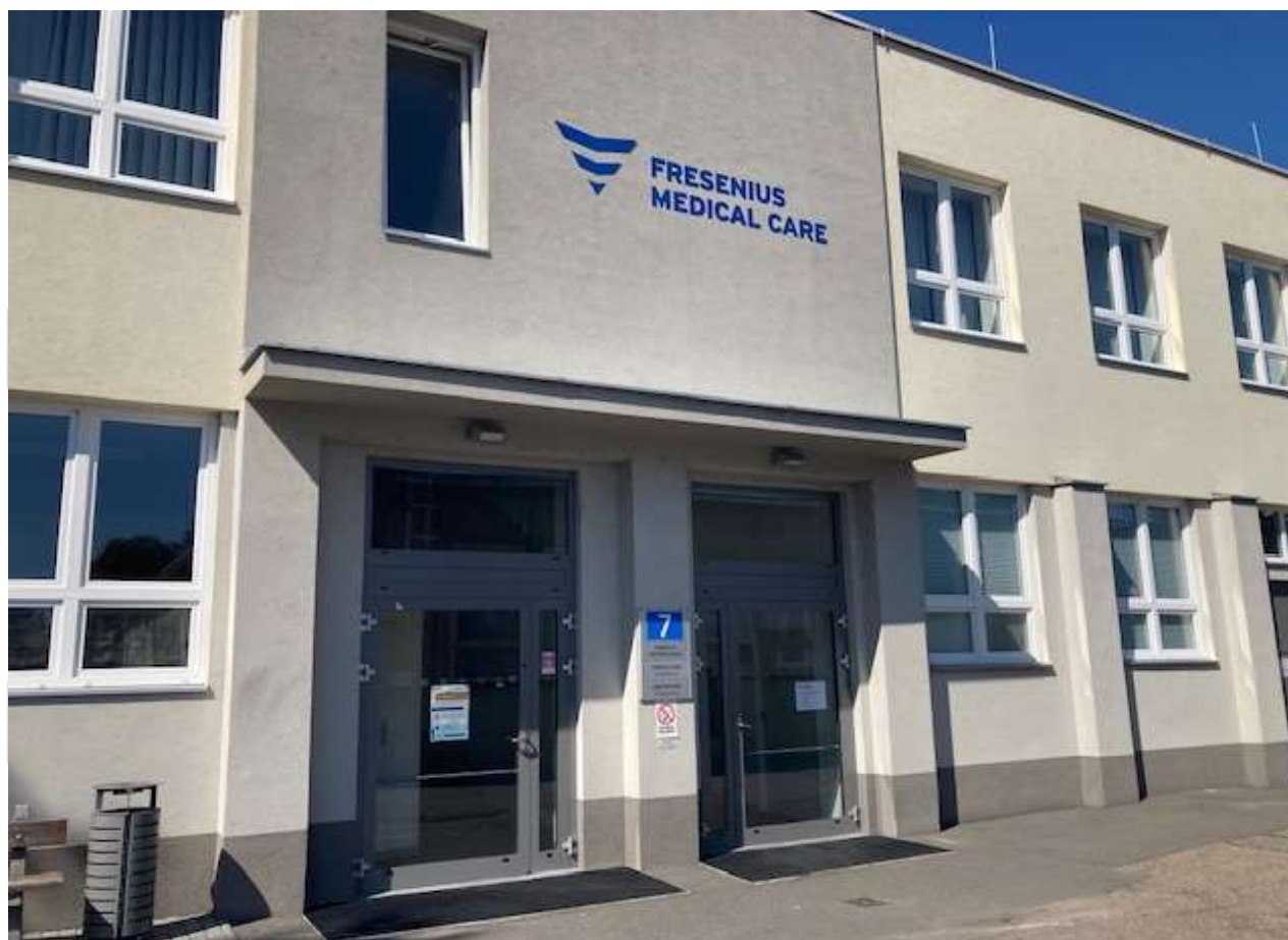
Budova č.7 - Vstup do Fresenius Medical Care