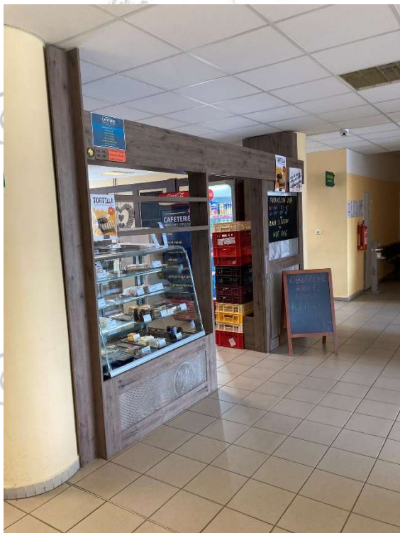
Občerstvení - obslužný pult