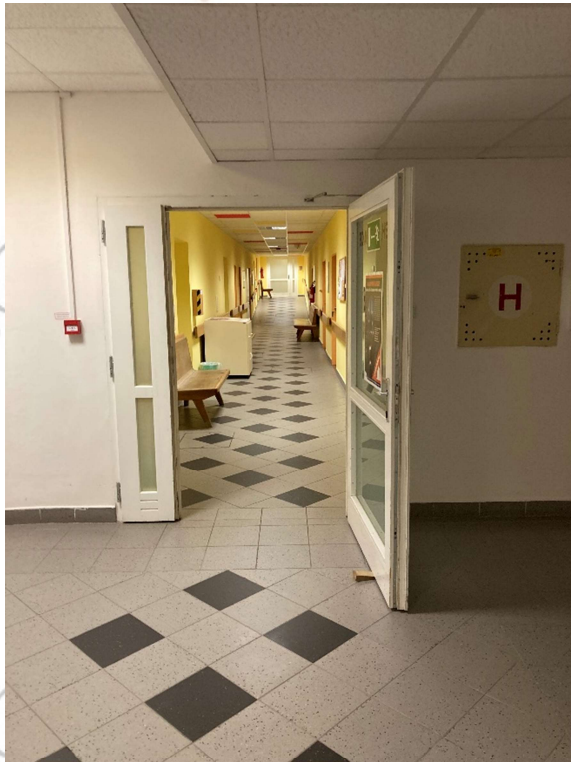
Rehabilitace (1.PP) - vpravo od výtahu