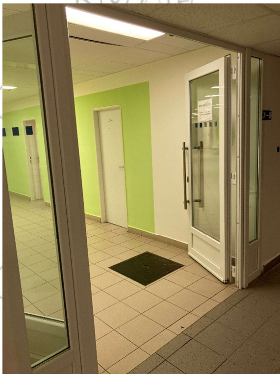
Rehabilitace (1.PP) - vlevo od výtahu