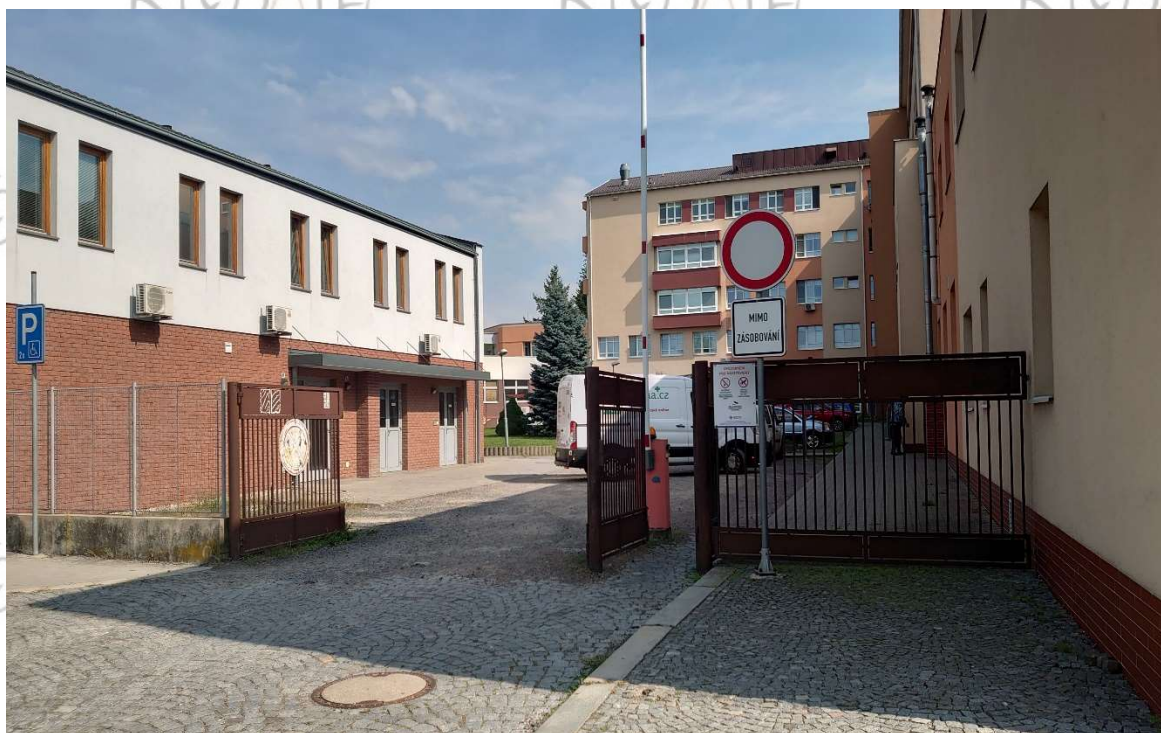
Vstup 1/B (od Lékárny)