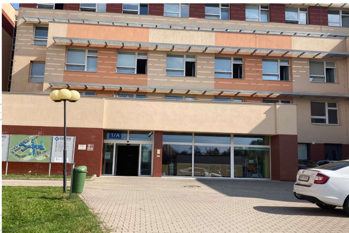
Hlavní vstup 1/A (od hlavního vjezdu do areálu nemocnice)