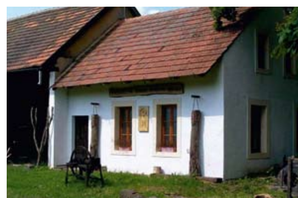
Hájovna Lipovka s muzejní expozicí.

Vynálezce a konstruktér Ludvík Očenášek (1872–1949) se narodil ve vesničce Kříše u Rokycan v chudé rodině, v Dolní Bělě chodil do školy, životní cestu ukončil v nedaleké obci Dražeň. Z jeho vynálezů připomeňme alespoň první český monocykl (jednokolo), letecký hvězdicový motor, letadlo vlastní konstrukce pro dvě osoby, vzdušné torpédo, hydrodynamický