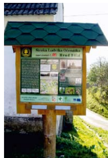
Dvanáct zastavení naučné stezky; popisky pro nevidomé jsou vespod tabule.

Top lákadlem regionu je rozsáhlý komplex cisterciáckého plaského kláštera a zámku rodu Metternichů – více informací o zdejší dominantě přináší web www.klaster-plasy.cz/cs . (mk)